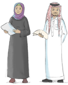
المهتمون بالتعليم بشكل عام